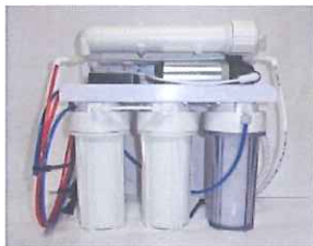
高性能逆浸透膜装置