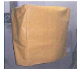
逆浸透膜装置用防水カバー