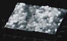
バリアクリスタル ガラス被膜 (30ナノメートル)

右の写真は、バリアクリスタル施工した車のボディ表面を電子 顕微鏡で撮影したもの。粒状の白いものがガラス被膜。その厚 みは、驚異の30ナノ。電気メッキの原理で付いた極薄のガラス 被膜は、割れたり剥がれたりせず、いつまでも効果を発揮します。